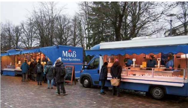
Der Volksdorfer Wochenmarkt zählt zu den größten und schönsten Märkten Hamburgs.

Unter freiem Himmel einkaufen kann man mittwochs und samstags auf dem Wochenmarkt – einer der größten und schönsten Märkte Hamburgs. Frisches Bio-Gemüse aus den Vierlanden bei Behncken, hofeigene Bio-Lebensmittel von Ehlers, Blumen bei Bärbels Blumenkiste, Fleisch bei Duve oder Fisch bei Kalinowski – die Volksdorfer kaufen gerne an den gut 100 Ständen ein, die Stimmung ist herzlich und familiär. Traditionen werden dabei hochgehalten. So hat auf dem Wochenmarkt jeder Volksdorfer seine persönlichen Favoriten, bei denen die Familie manchmal schon über mehrere Generationen an den Verkaufstresen stehen – schließlich kamen die ersten Bauern und Händler schon vor über 60 Jahren mit ihrer Ware auf den Marktplatz. Wer über das Areal schlendert, stößt auch auf den Bioladen „Ohne Gedöns“, der gleich nebenan liegt und Mehl, Müsli, Nudeln, Linsen und vieles